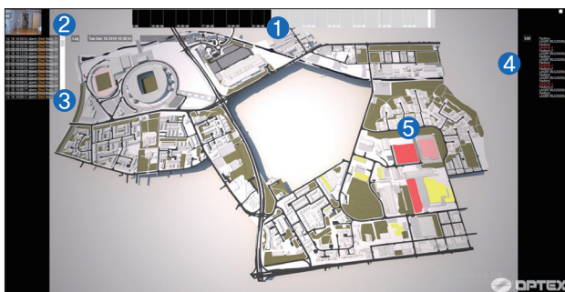
센서 모니터링 맵 시스템 화면